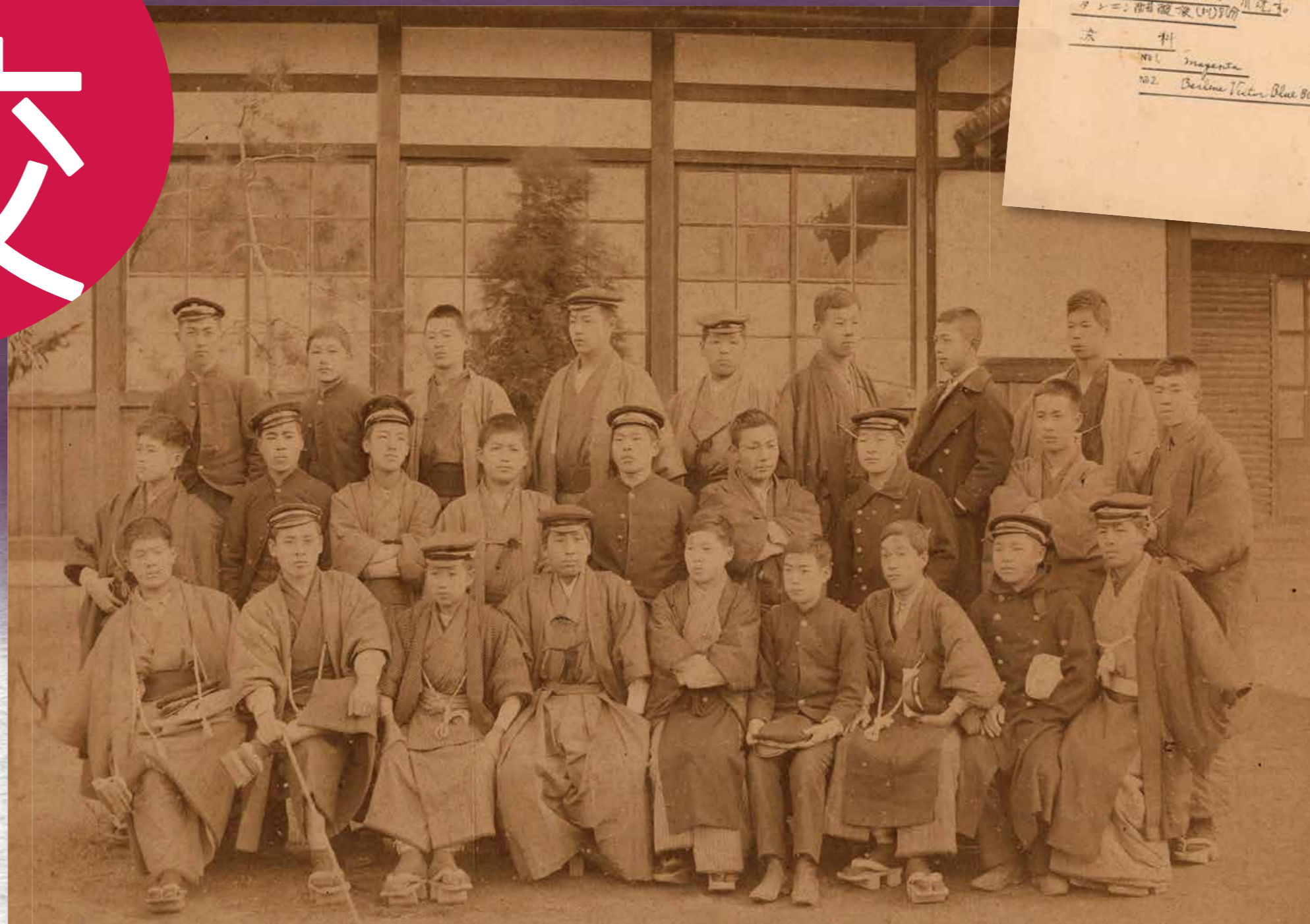
卒業写真, 1896(明治29)年, 京都府商業学校