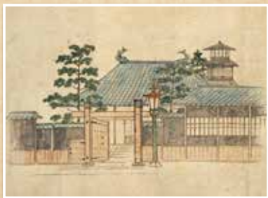
開智校写生図 明治10年頃