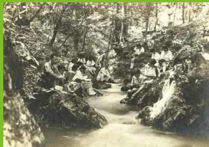
林間学校での自由読書 大正9(1920)年