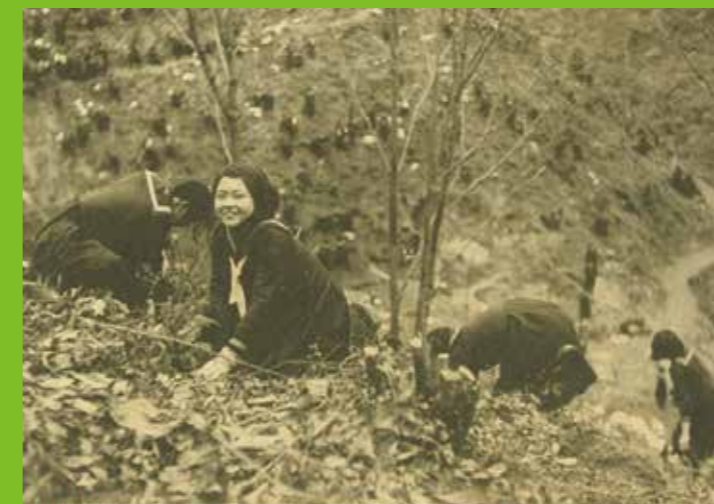
土に親しむ 昭和14(1939)年