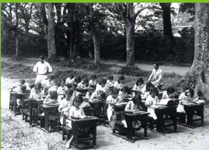
紵の森林間学校 大正期