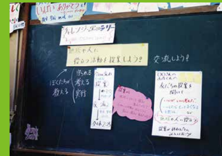
環境教育の授業 平成13(2001)年