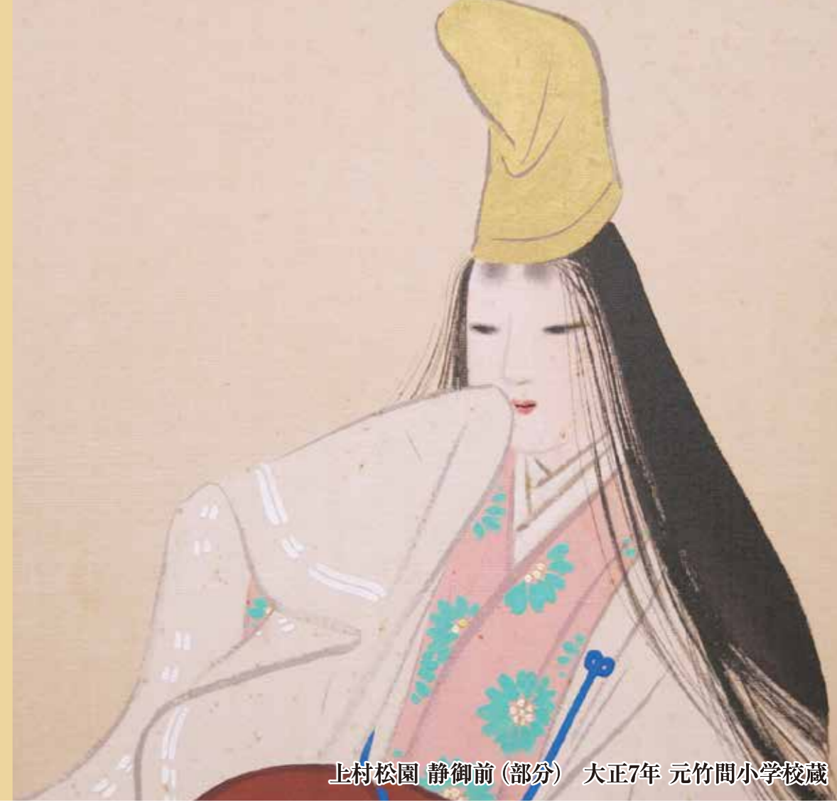
上村松園 静御前(部分) 大正7年 元竹間小学校蔵