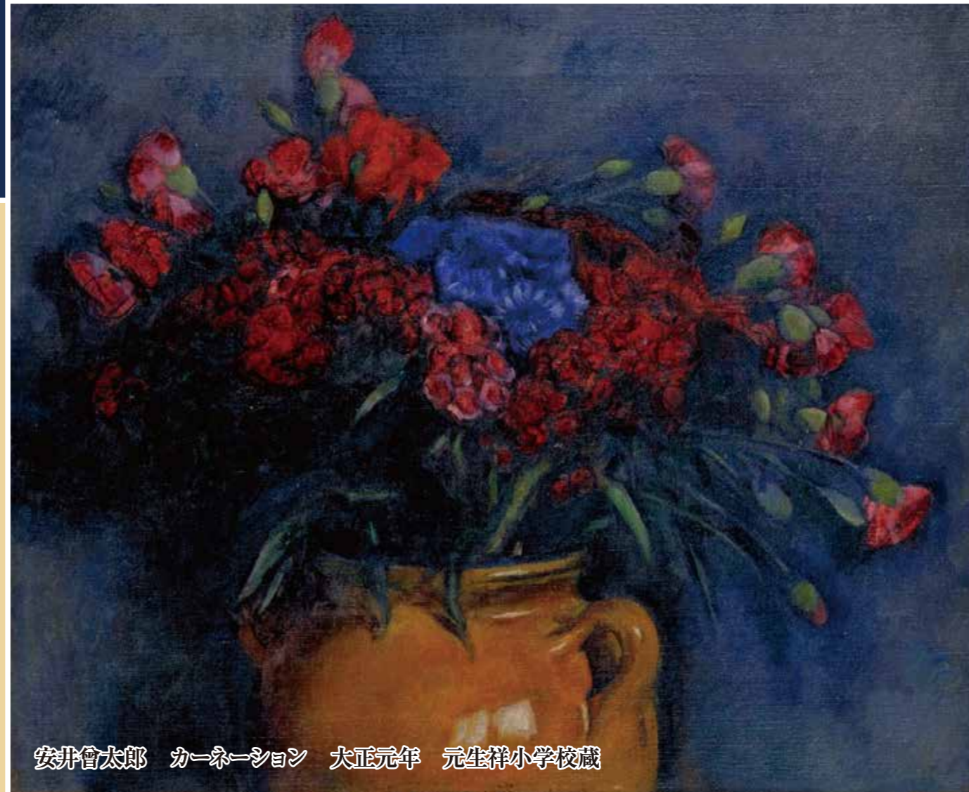
安井曾太郎 カーネーション 大正元年 元生祥小学校蔵

絵画的というのは、 自然の単なる模写ではなく、 線と色彩と明暗との 確固とした構成の内に対象物を 最も清新に表現することである。