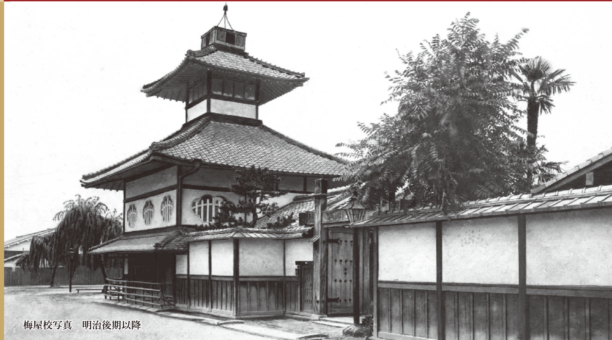
梅屋校写真 明治後期以降

新型コロナウイルス感染症への対策のため、期間・内容等が変更となる場合があります。