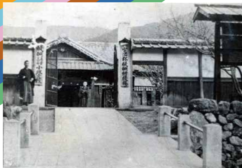
醍醐校校門 明治35(1902)年頃