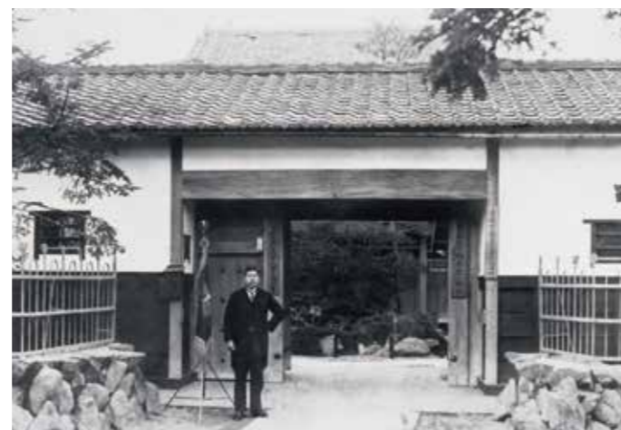
下鴨校写真 大正末から昭和はじめ