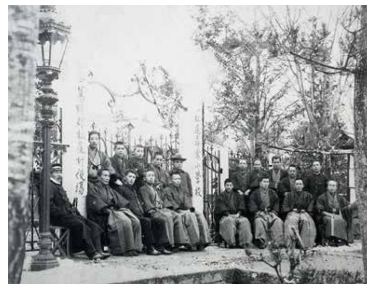
松尾校校門 明治後半(推定)