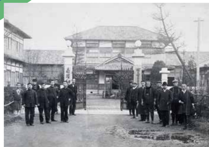
伏見南浜校校門 明治43(1910)年頃