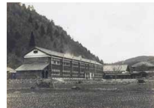
大原校校舎 昭和12(1937)年