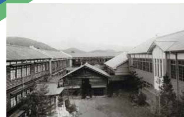
上賀茂校校舎 昭和6(1931)年