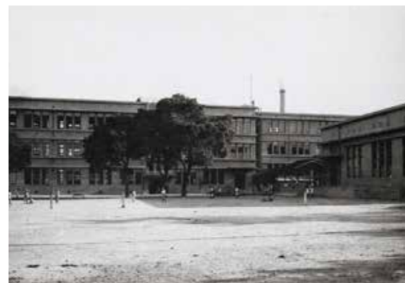
七条校校舎 昭和5(1930)年