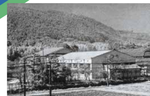
嵯峨校校舎 昭和10(1935)年