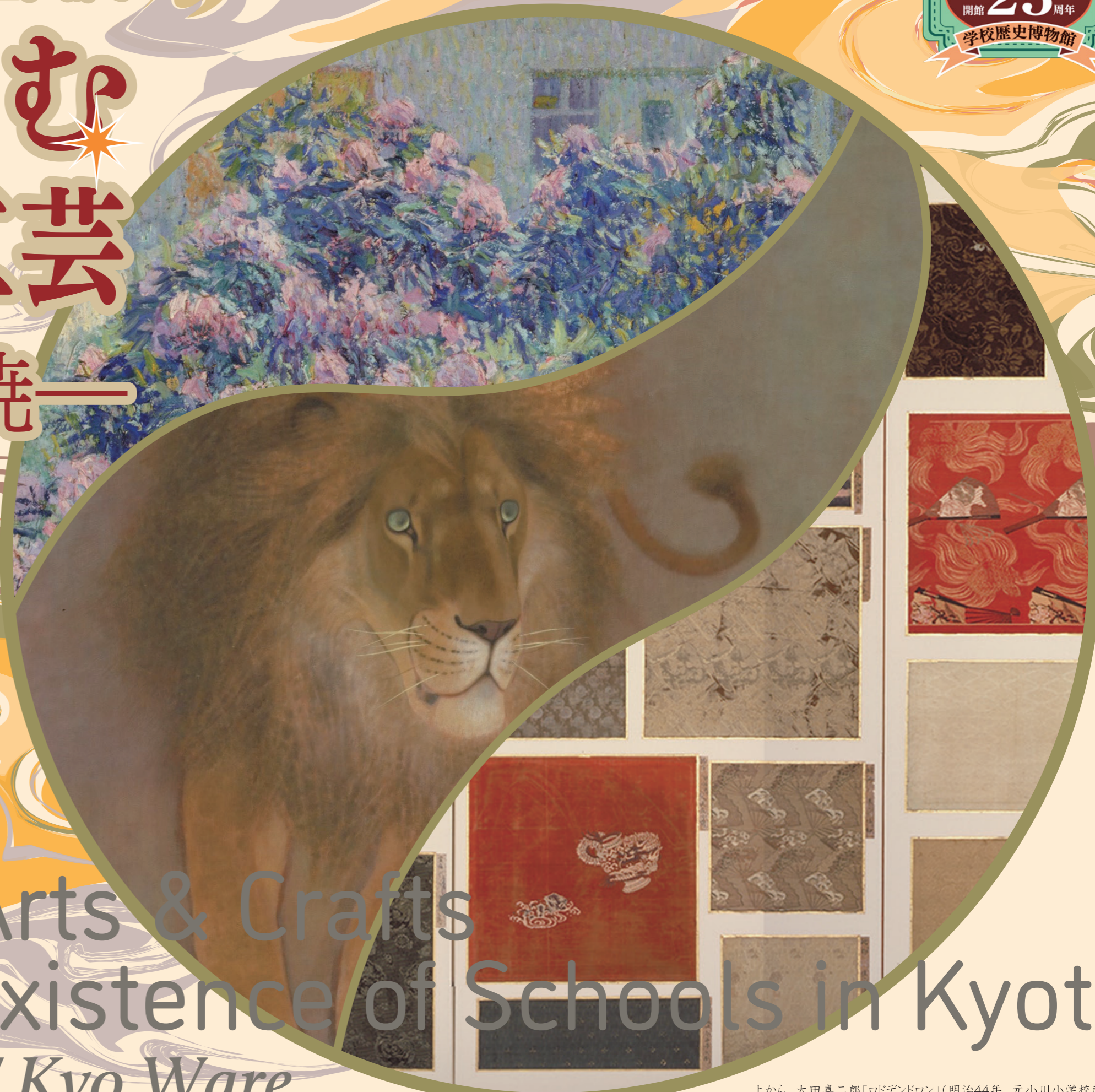
上から 太田喜二郎「ロデンドロン」(明治44年 元小川小学校蔵)部分 山口華楊「凝視」(昭和37年 元格致小学校蔵)部分 「西陣織裂貼交屏風」(明治25年 元西陣小学校蔵)部分

Nishijin Textiles / Kyo Textiles / Kyo Ware