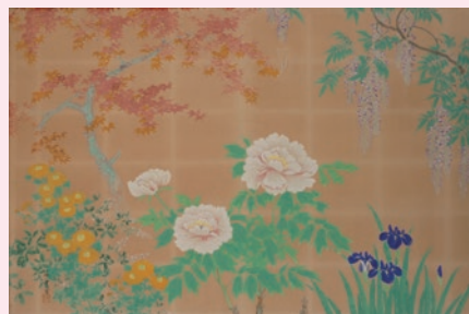
1. 川村曼舟「旭日桜花図・月波瀟図」(大正12年頃 元本能小学校蔵) 2. 廣田百豊「山櫻鳩図」(20世紀 元滋野中学校蔵) 3. 福田恵一「菅公の図」(昭和14年頃 錦林小学校蔵) 4. 小西福年「花卉図」(20世紀 元聚楽小学校蔵) 等の美術工芸品約30点と教科書をはじめとする関連資料を展示予定