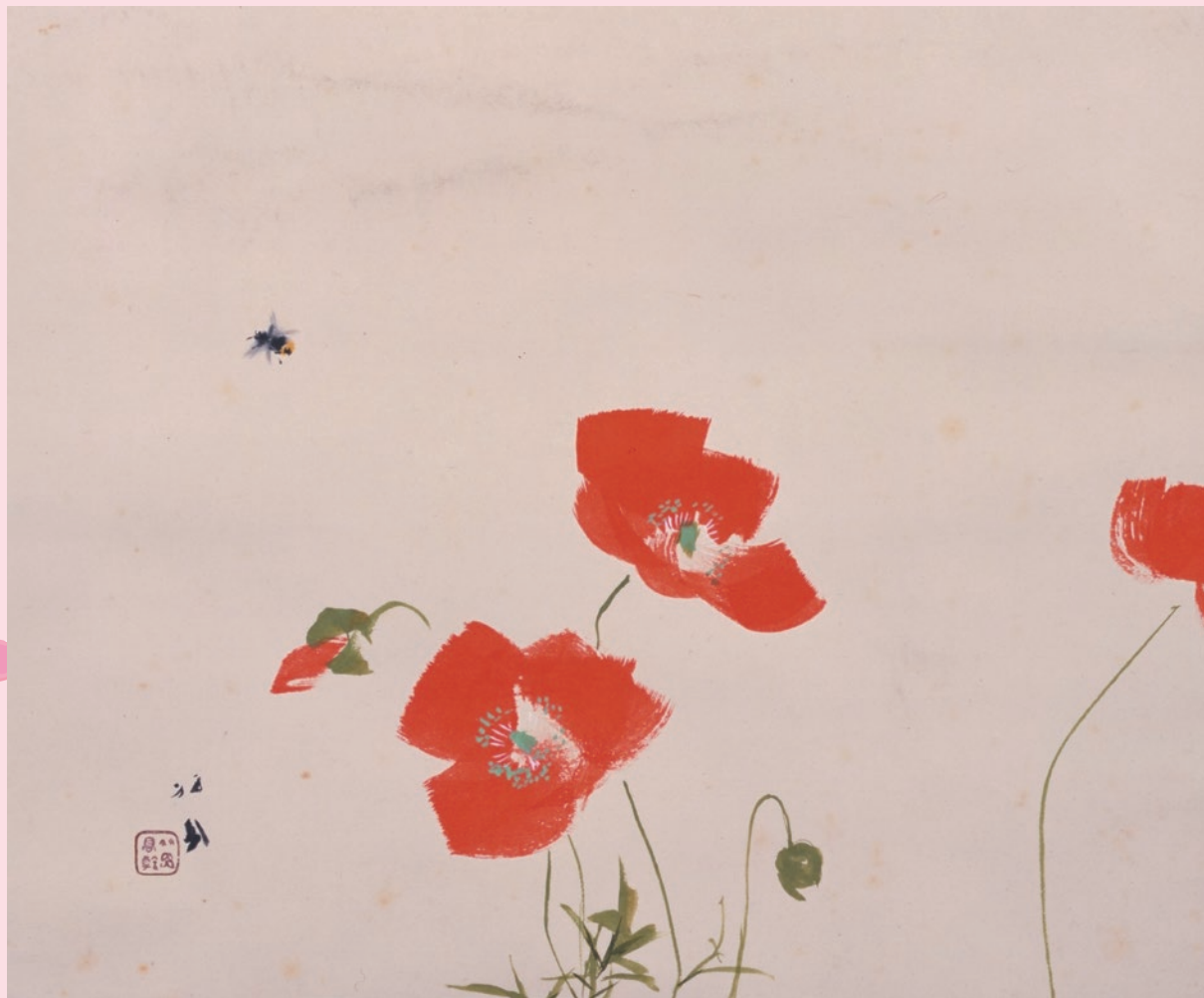
竹内栖鳳「虞美人艸」(大正9年頃 学校歴史博物館蔵)