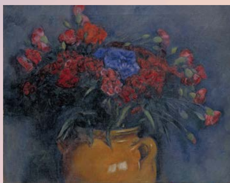
安井曾太郎「カーネーション」 大正6(1917)年頃 元生祥小学校蔵