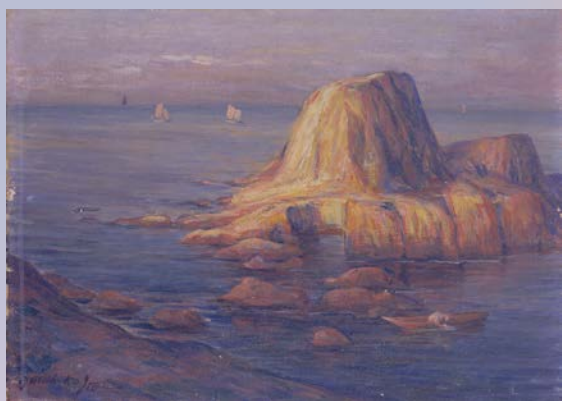
伊藤快彦「海」制作年代不明 元修徳小学校蔵