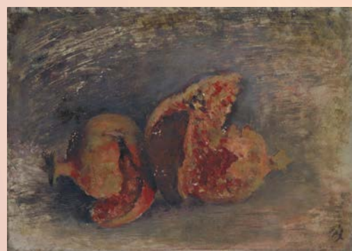
須田国太郎「石榴図」 昭和期 元西陣小学校蔵

京都市学校歴史博物館では、京都市の学校園に伝わる作品を管理しています。それらの作品のなかには、京都で活躍した洋画家たちによる作品や京都の風景を描いた洋画も含まれています。