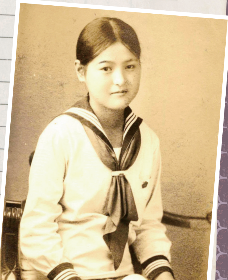
昭和6 (1931) 年頃 京都府立京都第二高等女学校