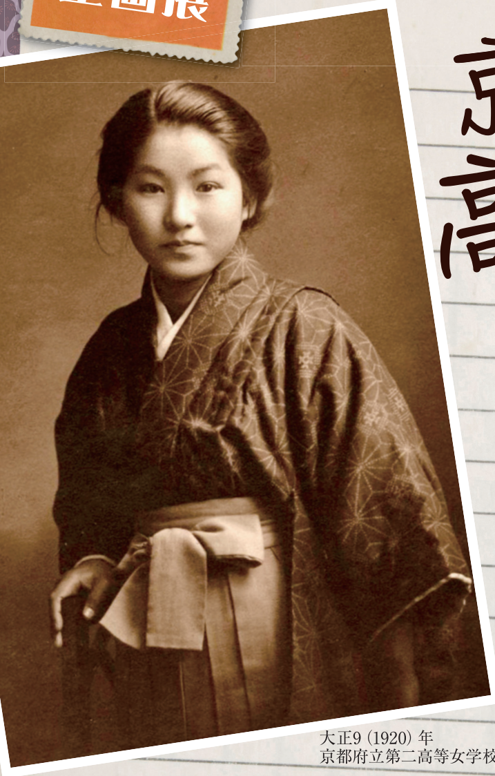
大正9 (1920) 年 京都府立第二高等女学校