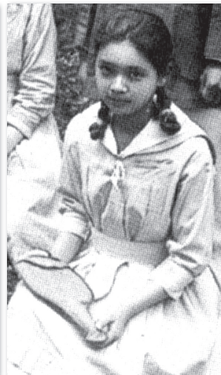
日本初のセーラー制服（夏服） 1923（大正12）年 平安高等女学校