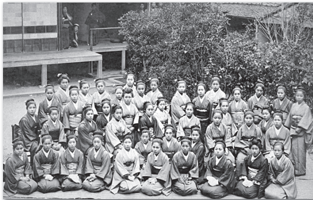
1895（明治28）年頃 京都府高等女学校

高等女学校とは、昭和23（1948）年まであった、女子中等教育の学校です。学年は、現在の中学1年から高校1年～2年にあたり、入学するためにはきびしい入試を突破しなければなりません。京都市内には、昭和16（1941）年4月の時点で公立6校、私立10校がありました。しかし、高等女学校がいかなる学校であったのか、学校ではどのような服装で過ごし、どのような教科内容を学んでいたのかなど、今日ではあまり知られていません。そこで本展では、京都市における高等女学校の様子と、そこに通った女学生に関する資料を展示いたします。明治・大正・昭和戦前期の「女学生文化」を、ぜひご覧ください。