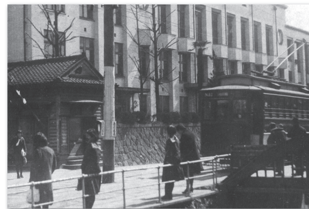
市電停留所「堀川蛸薬師（女学校前）」 1942（昭和17）年 京都市立堀川高等女学校