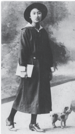
日本初のセーラー制服（冬服） 1920（大正9）年 平安高等女学校