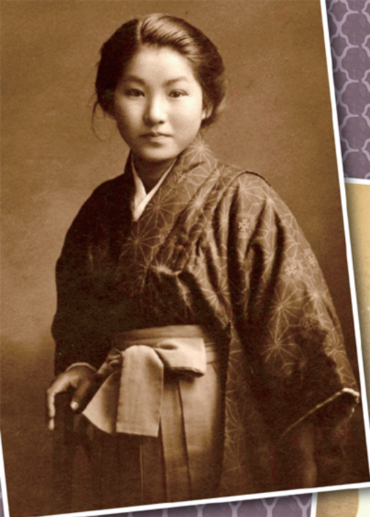
大正19(1920)年 京都府立第二高等女学校