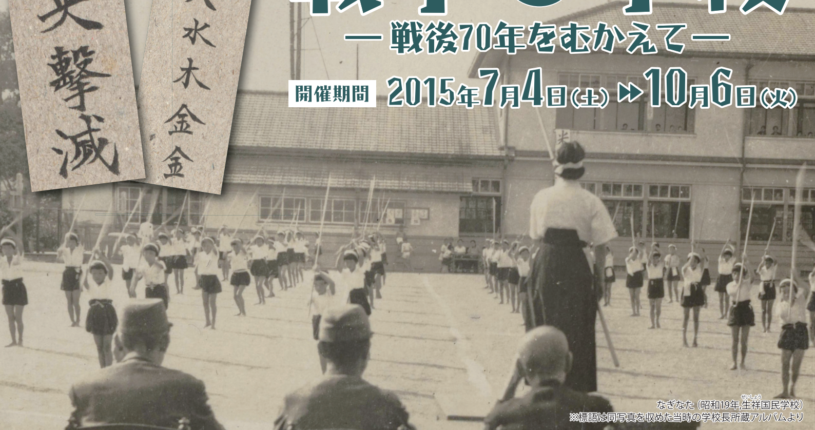
なぎなた (昭和19年, 生祥国民学校) ※標語は同写真を収めた当時の学校長所蔵アルバムより